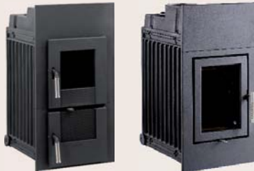
DIAMANT mit Holzfeuerung