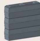
...ergänzt mit Guss-Speicherblöcken (ca. 3-5 Stunden längere effektivere Wärmeabgabe je Element)