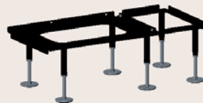
...stabil auf hochwertigem Traglager