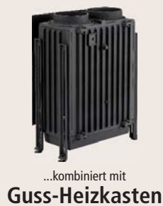
...kombiniert mit Guss-Heizkasten